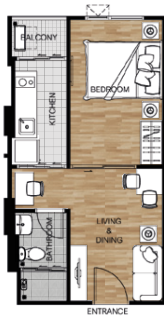
TYPE B AREA 32.00 SQ.M 1 BEDROOM