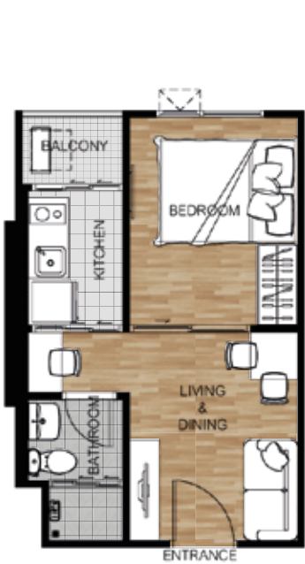
TYPE A AREA 26.00-26.50 SQ.M 1 BEDROOM