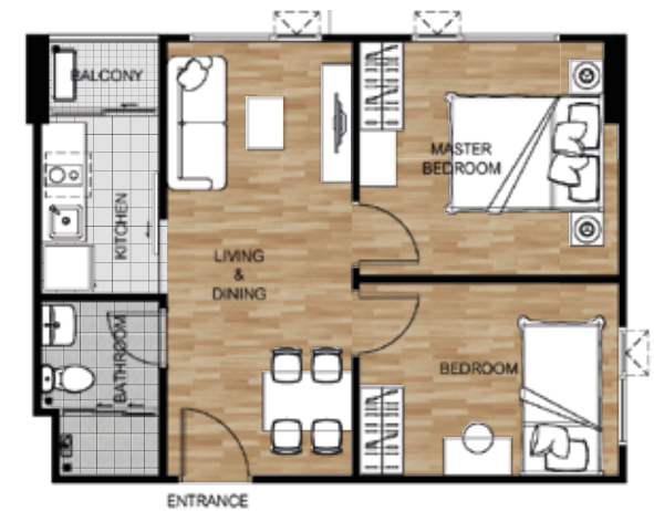
TYPE D AREA 45.50 SQ.M 2 BEDROOM

โครงการ ชิวทาย ฮอลล์มาร์ค ลาดพร้าว - โชคชัย4 (W2) เจ้าของโครงการ บริษัท ชิวทาย จำกัด(มหาชน) ทุนจดทะเบียน 1,825,027,883.00 บาท ทุนชำระแล้ว 1,275,027,883.00 บาท กรรมการผู้จัดการ นายบุญ ขุน เกียรติ สำนักงานใหญ่ตั้งอยู่ที่ 1168/80 อาคารลุมพินีทาวเวอร์ ชั้น 27 ยูนิคิต ถนนพระราม4 แขวงทุ่งมหาเมฆ เขตสาทรกรุงเทพมหานคร 10120 ที่ตั้งโครงการ ถนน สิบคมสงเคราะห์ แขวงสะพานสอง เขตจตุจักรกลาง กรุงเทพมหานคร โครงการก่อสร้างเป็นอาคารพักอาศัยสูง 8 ชั้น จำนวน 3 อาคาร อาคารสินค้าทางการ(คลังเช่า) 1 อาคาร เป็นชุดห้องพักอาศัยจำนวน 380 ห้อง และห้องชุดสำหรับการพาณิชย์ จำนวน 1 ห้อง พื้นที่โครงการ 3-3-2.5 ไร่ โฉนดที่ดินเลขที่ 10627 ที่ดินมีการผูกพันกับธนาคารสิทธิไทย จำกัด (มหาชน) ได้รับใบอนุญาตการวิเคราะห์ผลกระทบสิ่งแวดล้อม(EIA) และใบอนุญาตก่อสร้างแล้ว คาดว่าจะแล้วเสร็จ ประมาณ ม.ค.2566 และจดทะเบียนห้องชุดเมื่อก่อสร้างแล้วเสร็จ โดยผู้ซื้อต้องชำระเงินกองทุน และค่าใช้จ่ายส่วนกลางตามข้อบังคับนิติบุคคลอาคารชุด ทางโครงการขอสงวนสิทธิ์ในการเปลี่ยนแปลงรูปแบบ และขนาดพื้นที่ห้อง เพื่อให้เกิดความเหมาะสมรายละเอียดอาจจะแตกต่างไปจากภาพที่ปรากฏในการโฆษณา บริษัทฯ ขอสงวนสิทธิ์โดยไม่ต้องแจ้งให้ทราบล่วงหน้า