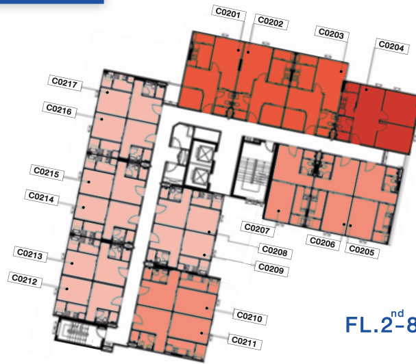
FL.2 nd -8 th Building C