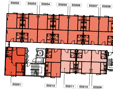
FL.2 nd -4 th Building E