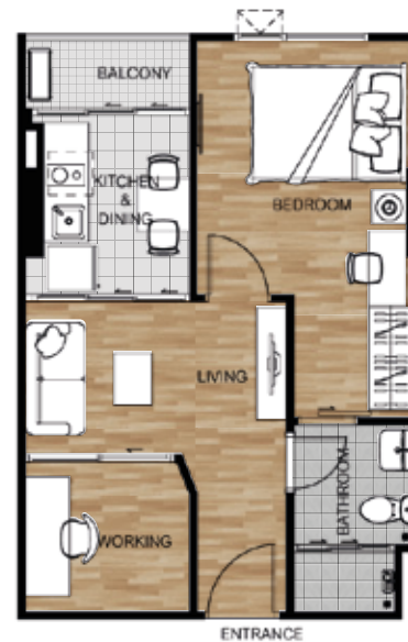
TYPE C AREA 40.00 SQ.M 1 BEDROOM PLUS