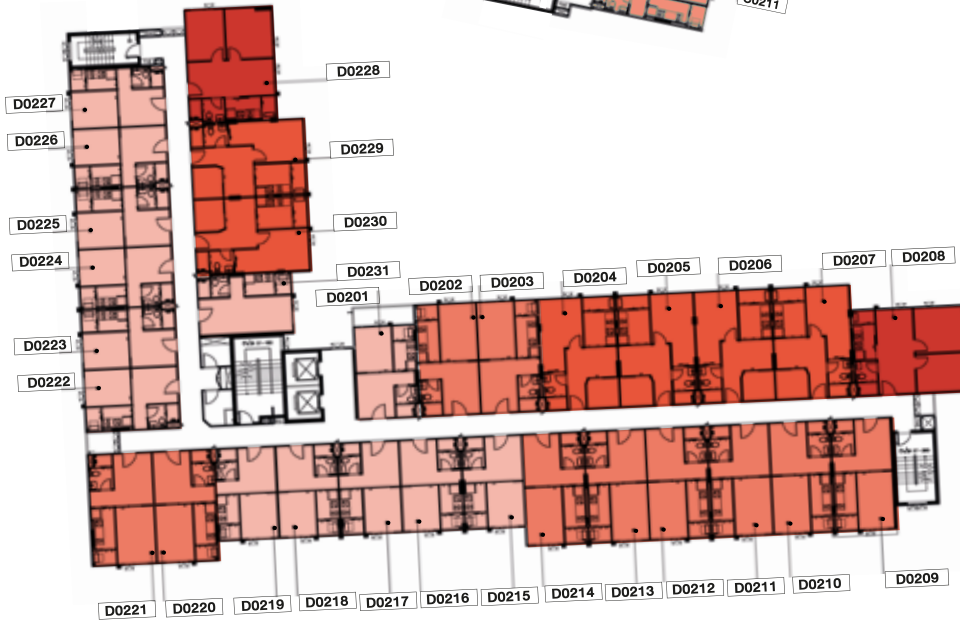
FL.2 nd -8 th Building D